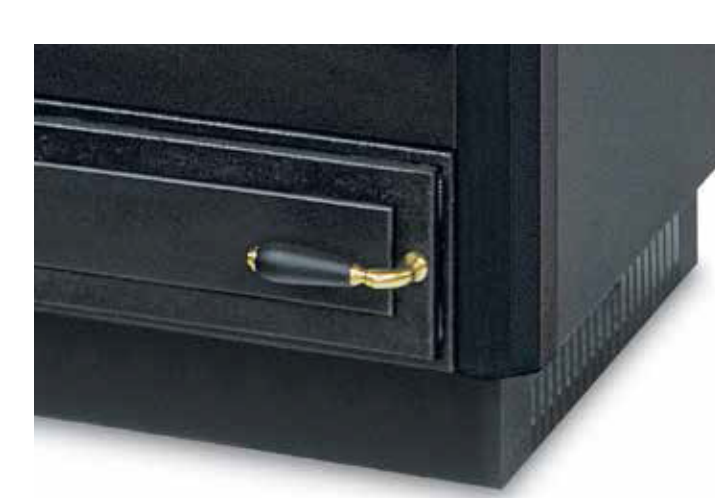
PLINTHE PEINTE OU INOX