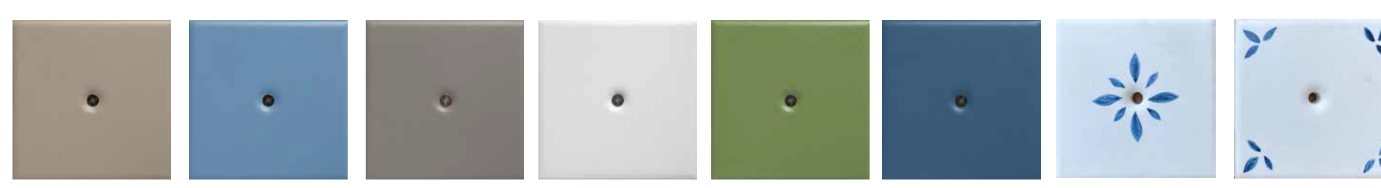
M 3 TORTORA