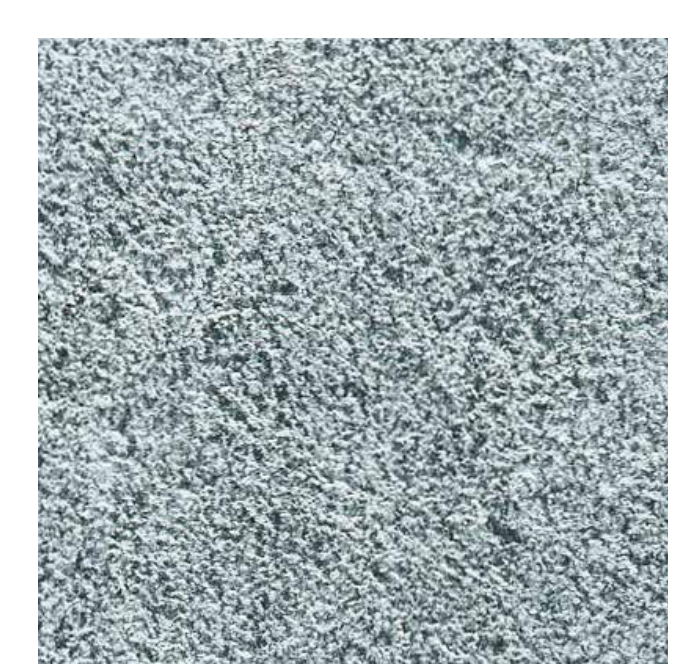
MODÈLES 90-140 OU SUR DEMANDE